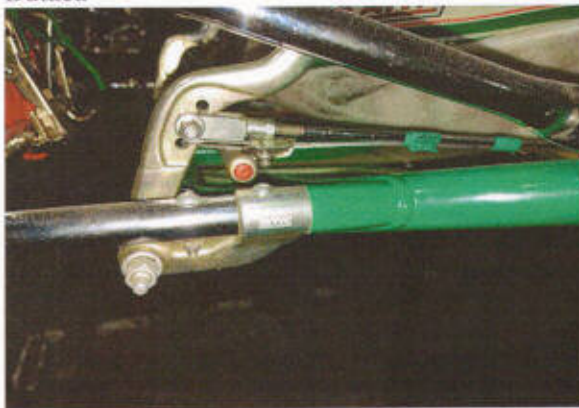
Anclaje pedal N°1