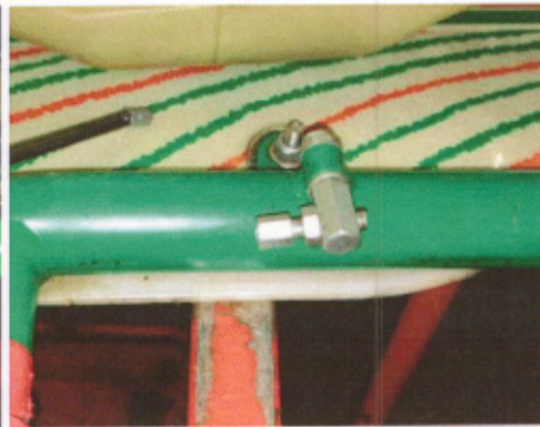
Tope de acelerador