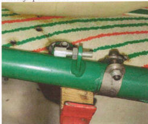
Tope de acelerador