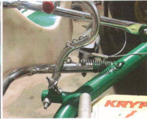
Anclaje pedal N°2