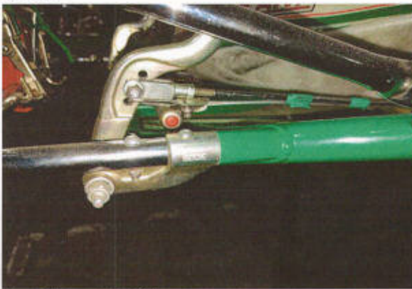
Anclaje pedal N°1