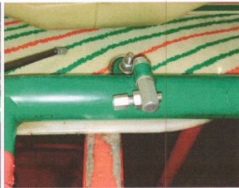
Tope de acelerador