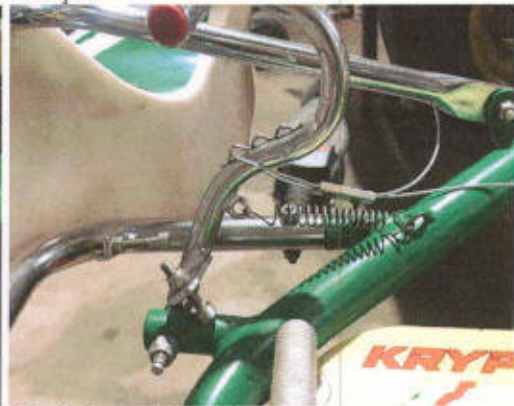
Anclaje pedal N°2