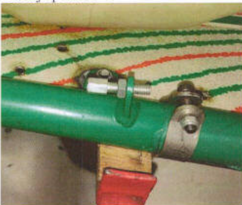
Tope de acelerador